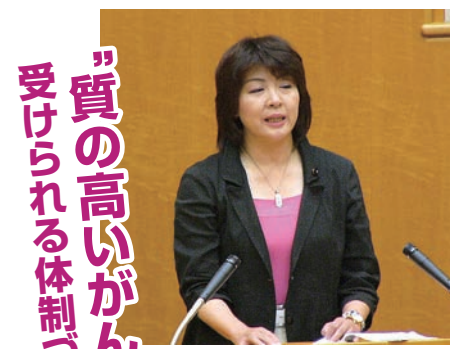
「プロフィール」 H23.4 愛知県議会議員に3期目当選 ○常任委員会/総務県民委員会 ○特別委員会/行財政改革・道州制調査特別委員会(副委員長)

制度などは事業者から希望があれば、がん患者などの病気療養者の職場復帰についても活用いただけるものとする。 Q:「手術待ち時間」が伸びているとの課題が全国的に言われるが、がんセンター中央病院の実態はどうか？また、この手術に関連して何らかの課題は？ A:全体的には概ね3週間から4週間となっており、ここ数年、手術待ち時間の短縮ができています。がんセンター中央病院においても特に、外科系医師や麻酔科医の確保が難しい状況が続き、この夏には3年ぶりに常勤麻酔科医1名について確保の目途が立った。現在、常勤麻酔科医4名で9つの手術室を稼働しており、常勤麻酔科医が十分に確保されれば1日当たりの手術件数を増加させ、手術待ち時間のさらなる短縮が図られるものと期待している。 Q照射費用300万円！名古屋市北区に整備される陽子線がん治療施設への支援は？ A:《大村知事》この陽子線がん治療施設の整備によって、治療の選択肢が増える。県内に21ある「がん診療連携拠点病院」を通じて、適応患者が適切に陽子線がん治療施設を紹介されるシステムを構築していく。